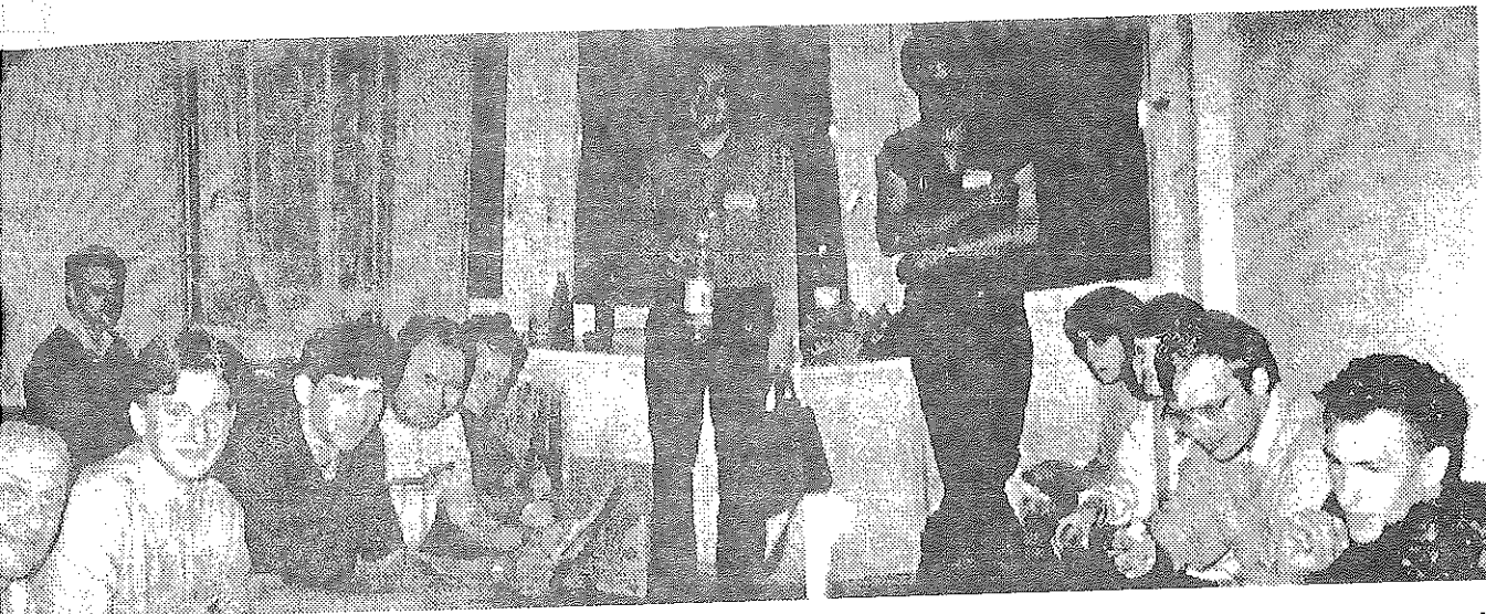
LY1BA užfiksuoja akimirka SĄSKRYDŽIO atidarymo išvakarėse. Iš kairės: LY2BIG, LYR-1220, LY1EB, LY1DS, LY2PAQ, LY1DQ, LY1DL, LY2BNM, YL of LY2PAQ, LY1AM, LY2H, LY1DZ.